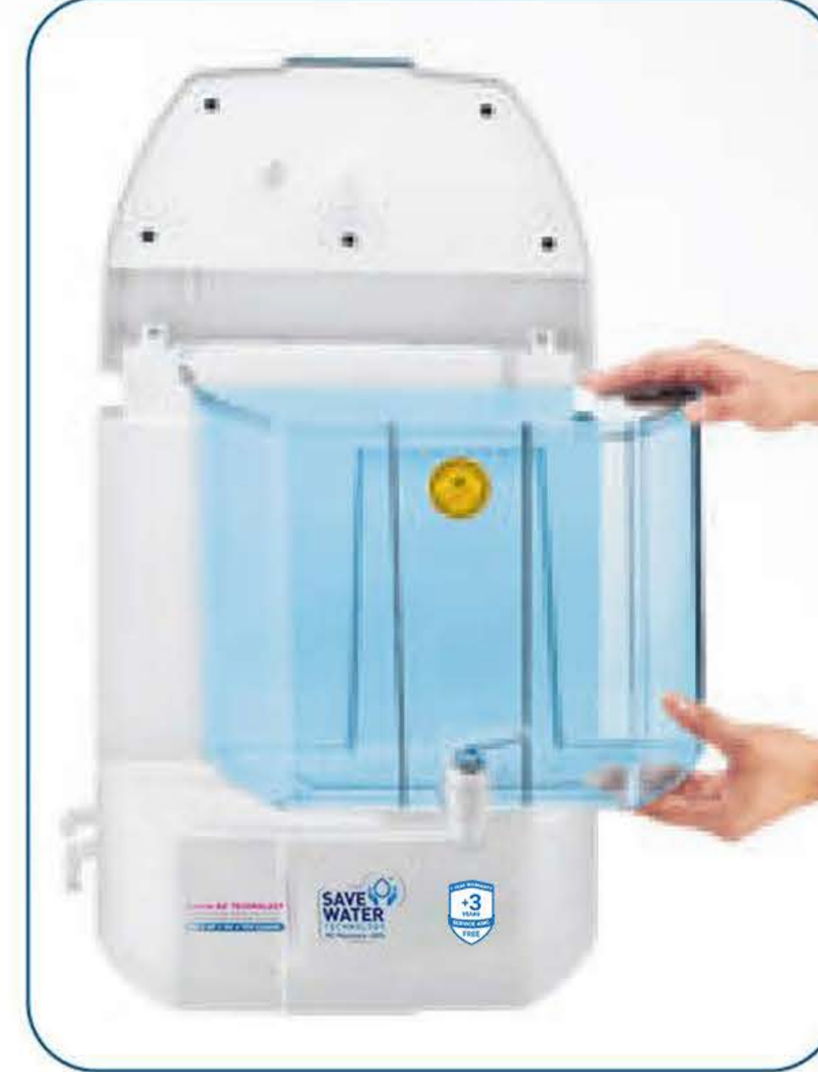
डिटैचेबल टैंक आसान ऑन साईट क्लीनिंग के लिए